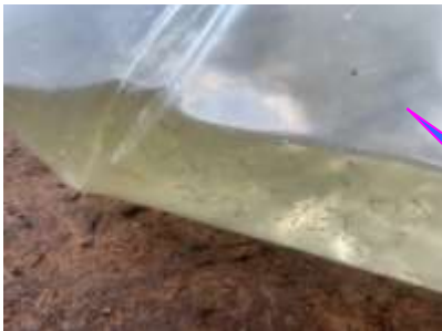
Déversement de larves de vairons sur la partie amont de la CADIÈRE (20 000 +20 000 offerts par le pisciculteur)