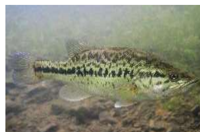
Un Black bass