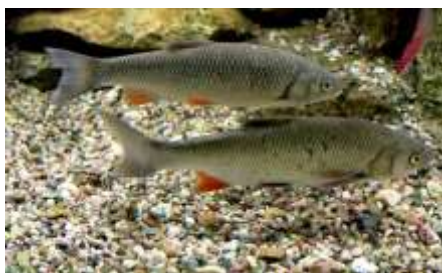
truite Fario Goujon Chevesne