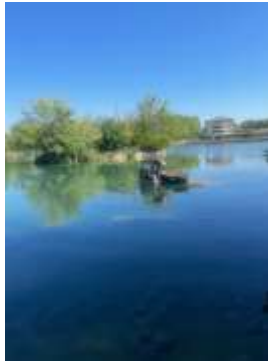
Un véhicule tombé dans le chenal du lac