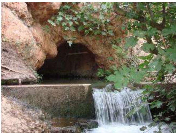
La source de la CADIÈRE