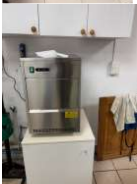
Acquisition d'une machine à Glaçons Prix : 525€