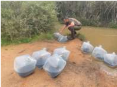
Alevins de truites Fario

1 000 vairons 862 truites émanant du ruisseau de la TREVARESSE 265 kg de Poissons Blancs (Spiralins, goujons, chevesnes etc... )